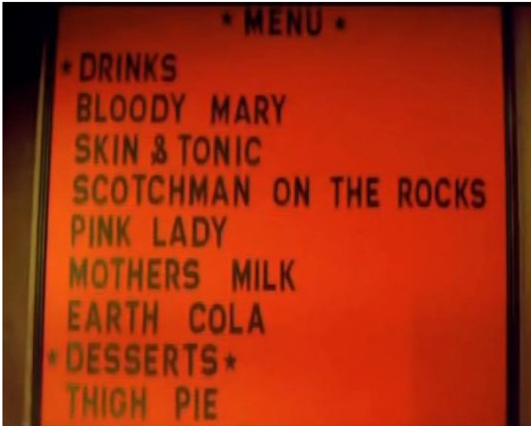
Menü im "Human Restaurant" (Aliens only!), Teil 1

Bemerkungen: Erklärung der Rahmenbedingung mit einlaufender Schrift wie bei Star Wars; stilistisch erinnert viel an Star Trek; Polizei-Raumschiff; Roboter "der Intelligenzstufe 11" steuert das Schiff; erster Auftritt des Kapitäns ist untermalt mit Musik aus 2001 - Odyssee im Weltall; Hommage an Alien (im Wesentlichen die Geburtsszene); über den Film: "Das gibt's nicht! (...) Dieser Film hätte nie gedreht werden dürfen (...) Ich glaub einfach nicht, was ich da grade gesehen habe!"